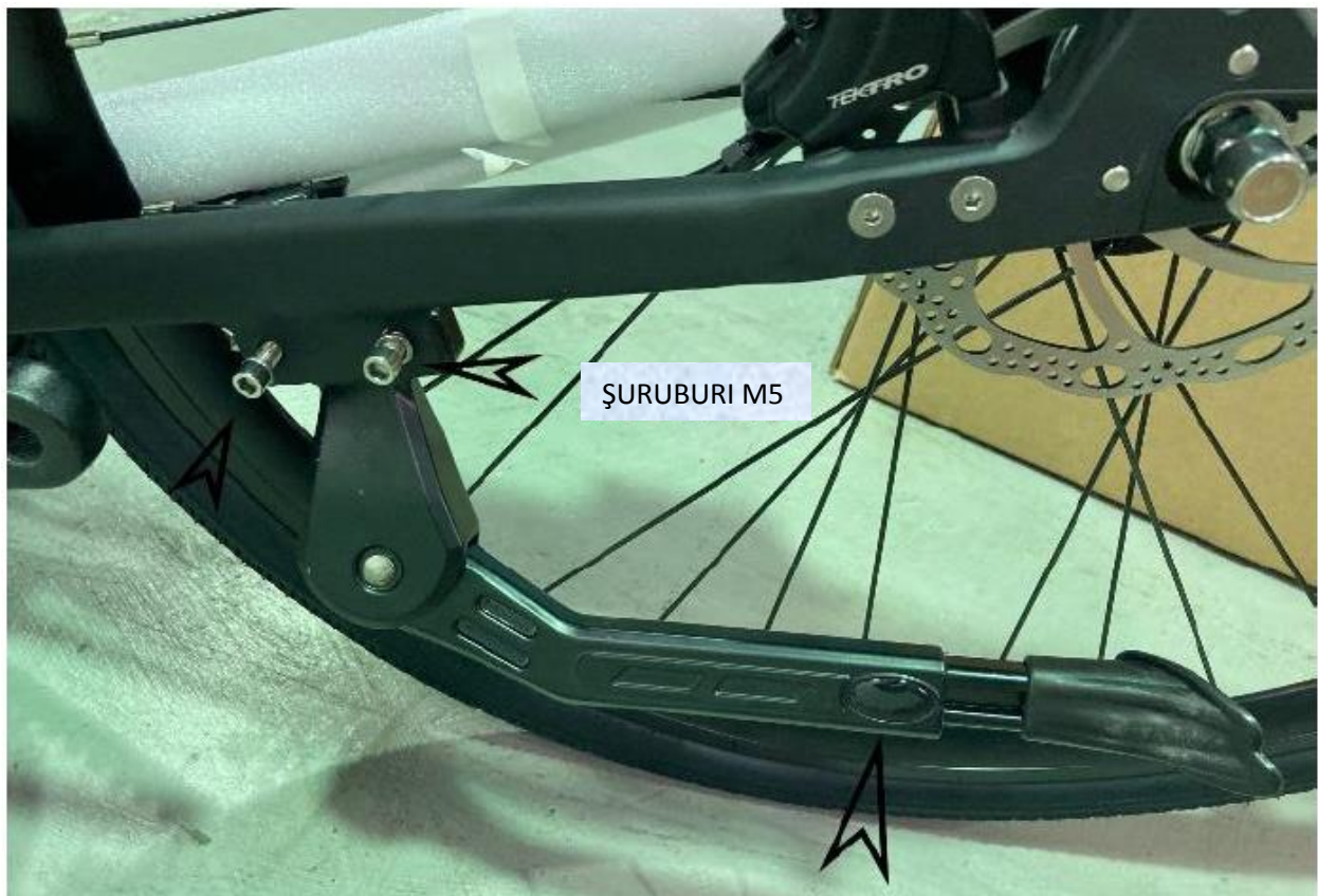
Șurub pentru reglarea lungimii cricului

Asigurați-vă că aceste șuruburi sunt strânse bine la un cuplu de 9-11Nm, folosind o cheie dinamometrică.